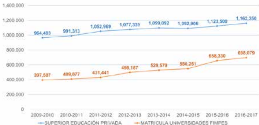
Figura 2. Matrícula en IESP y en universidades FIMPES

El crecimiento de la matrícula de universidades miembros de FIMPES en los últimos 8 años ha sido de 76%, mientras que el crecimiento de la matrícula de las universidades particulares en total ha sido del 21%, como se observa en el siguiente gráfico (FIMPES, 2018b).